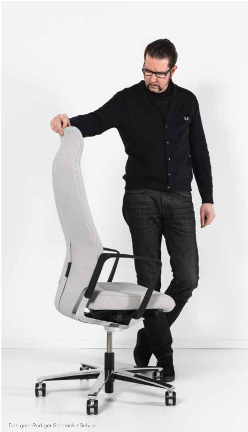
Designer Rüdiger Schaack / Selvio